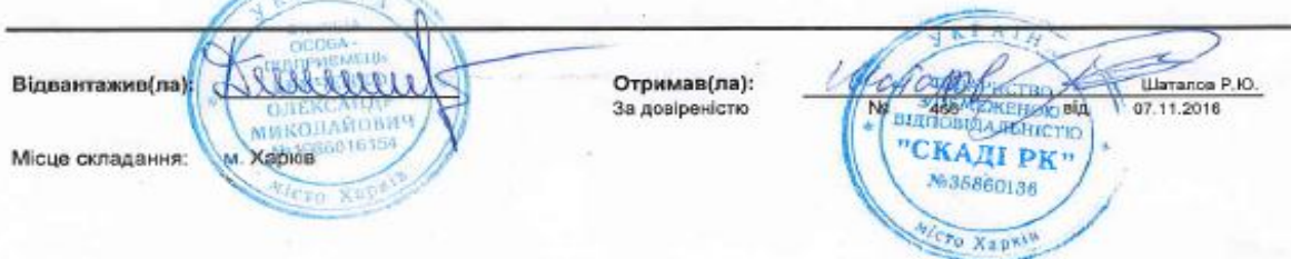
Рис. 4 - Видаткова накладна ТОВ «СКАДІ РК»

У т.ч. ПДВ: Шість тисяч сто шістдесят шість гривень 67 копійок