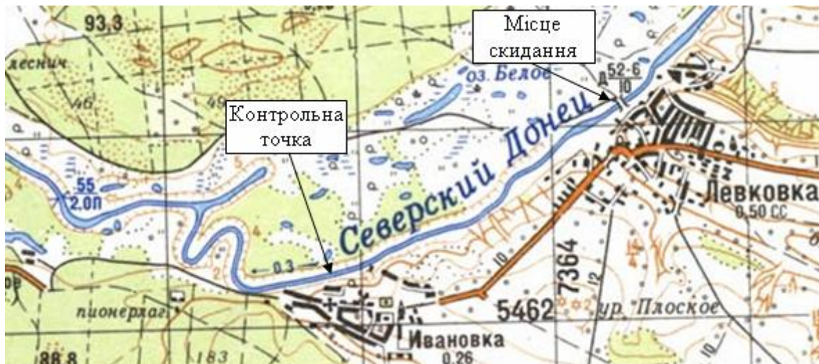
Рис. 2 – Карта місцевості з позначенням місця скидання НХР та контрольної точки для визначення C_{max}

то); K=0,3 1/доба (літо), j = 0,8 ; ГДК_в=0,3 мг/л; додатково визначаємо для зими: n_л = 0,05 ; D_n = 28,02 м; уточнюємо: K=0,02 1/доба; Y=1 ; здійснюємо розрахунки відповідно до підходу, викладеного вище.