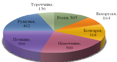
Рисунок 2 – Діаграма кількості заявок, що надходять з України у період 2015-2016року

На рисунку 3 показано кількість заявок, які надходять в Україну. Найбільше заявок надходить з: Туреччини, Росія, Білорусь та Польща.