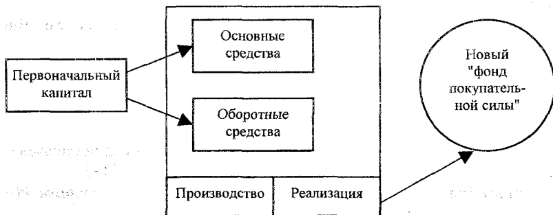
Рис.1 – Движение капитала в начале производственной деятельности

Учитывая это, движение капитала на предприятии можно представить следующим образом: