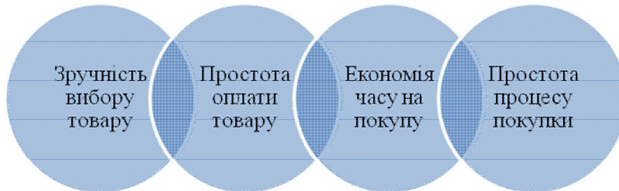
Рисунок 3 – Причини популярності «мобільних» покупок

Важливим фактором, який призвів до збільшення популярності мобільного Інтернету є щорічне збільшення кількості смартфонів, покращення та розширення їх функціоналу, поява на ринку таких мобільних пристроїв як планшет. Варто зазначити, що на зростання популярності онлайн покупок, які здійснюються за допомогою мобільних пристроїв, впливають переваги, що надає споживачам цей спосіб купівлі товару (рис.3).