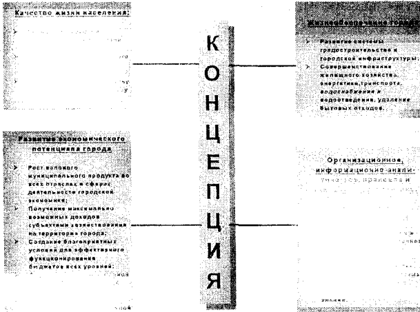
Рис.1 – Структура и основные положения Концепции