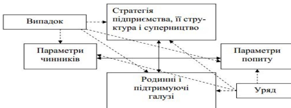
Рисунок 2.2 – Детермінанти конкурентної переваги країни («національний ромб»)

Для оцінки чинників зовнішнього середовища, що впливають на рівень конкурентної переваги і на формування стратегії підприємства, необхідно відзначити існування концепції конкурентної переваги країни, висунутої відомим економістом Майклом Портером. Основу цієї концепції складає ідея так названого «НР», що розкриває чотири властивості (детермінанту) країни, що формують конкурентне середовище, в якому діють підприємства (рис.2.2).