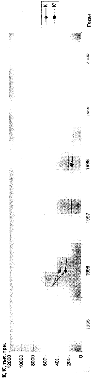
Рис.1 – Динамика инвестированного и "нового" капитала на предприятии 1