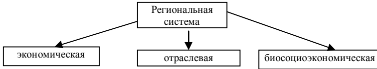
Рис.2 – Типы региональных систем

ее целостность. В зависимости от структурного построения РС могут быть разных типов и их формирование напрямую зависит от тех задач, которые ставит перед собой исследователь. Мы предлагаем рассмотреть три типа РС (рис.2).