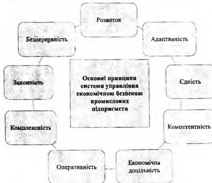
Рис. 1. Принципи системи управління економічною безпекою промислових підприємств*

Суб'єкти системи управління економічною безпекою можна поділити на внутрішні (працівники підприємства) та зовнішні (держава та її інститути, банки, конкуренти, посередники, споживачі, постачальники).