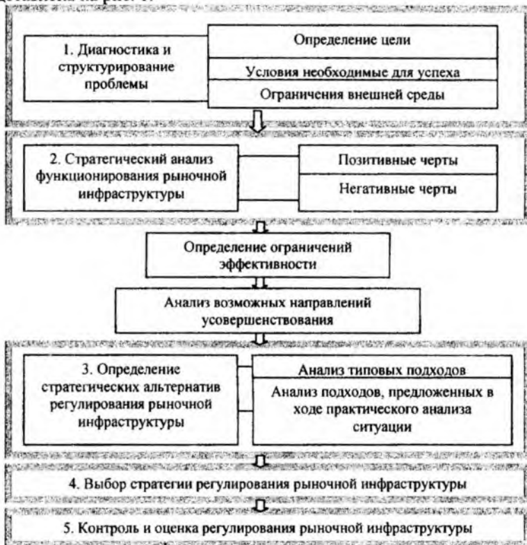
Рис. 1. Процесс стратегического регулирования рыночной инфраструктуры региона

стратегического регулирования рыночной инфраструктуры представлена на рис. 1.