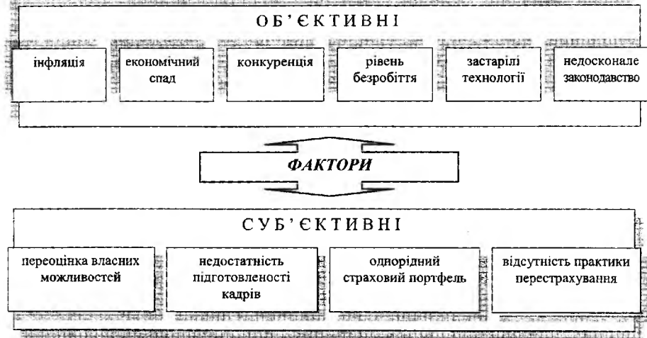
Рис. 2. Класифікація проблемних факторів розвитку страхових компаній

Необхідного вирішення потребують проблеми збільшення місткості регіонального страхового ринку, об'єднання розрізнених страхових фондів компаній. Ця проблема може бути розв'язана завдяки розвитку такої його складової, як перестраховання.