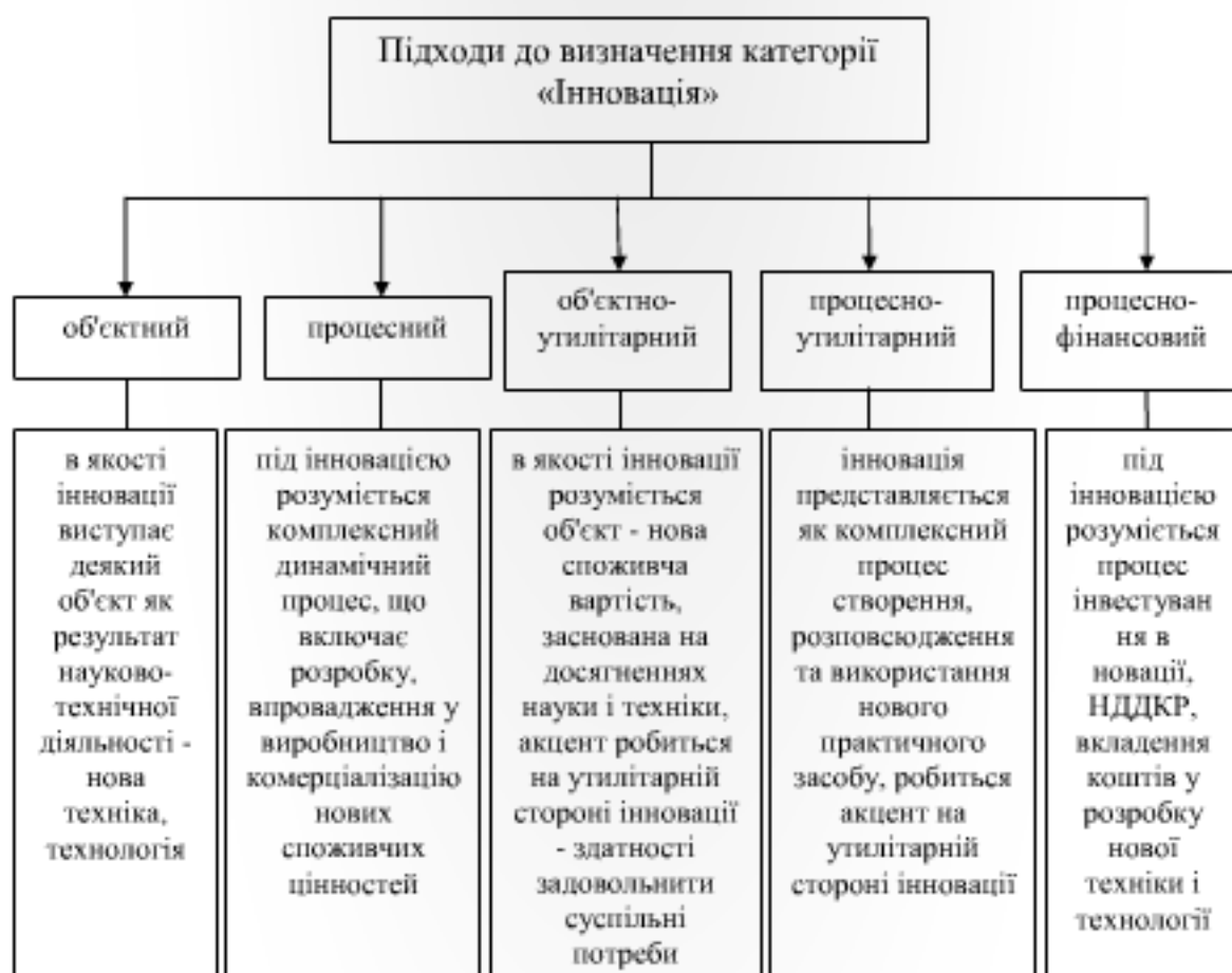
Рис. 1. Основні підходи до визначення категорії «інновація»

Узагальнюючи визначення, під інновацією, як чинника розвитку міста, на думку автора, варто розуміти результат практичного втілення нових ідей і знань з метою їх використання для задоволення запитів мешканців міста.