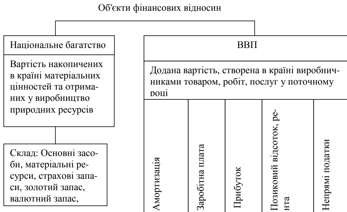
Рисунок 1.2 – Об'єкти фінансових відносин

Розподіл ВВП є необхідна умова забезпечення безперервності виробництва. Фінансові потоки виконують роль сполучної ланки між невеликими ЛС, без них неможливо нормальне функціонування системи. Тільки ВВП сприяє стабільному процвітанню держави.