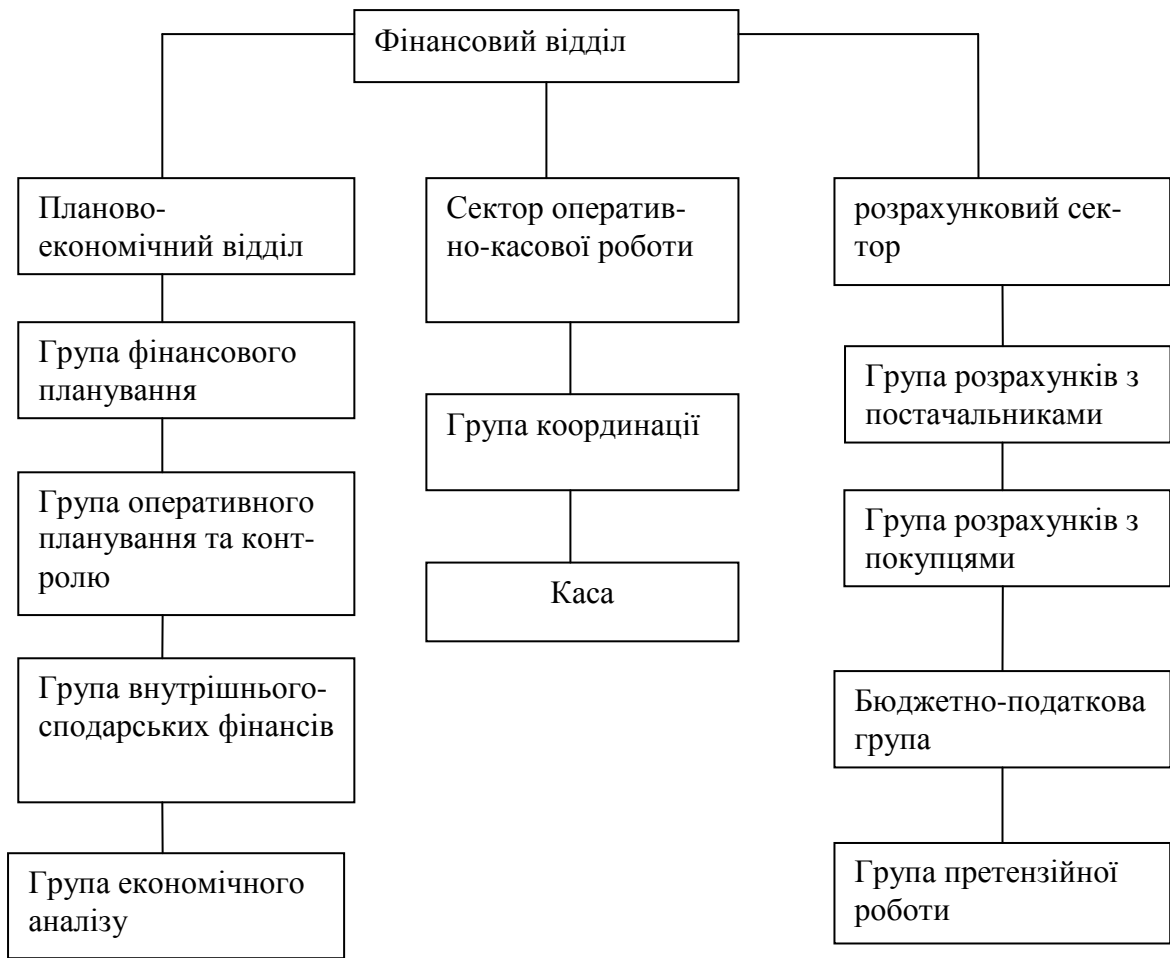
Рисунок 1.4 – Структура фінансового відділу