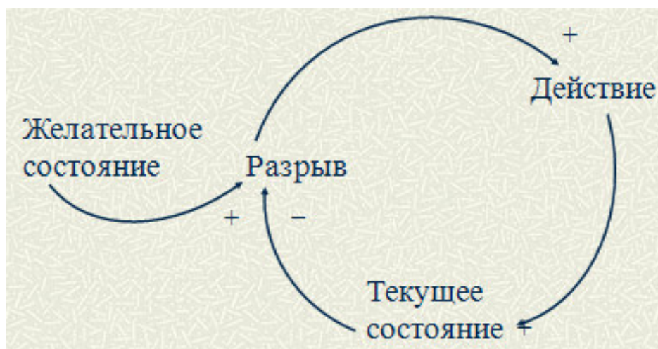
Рисунок 1. Модель-архетип «балансирующая петля»

Такой подход возможен для реализации эволюции любого структурного подразделения университета и выпускающих кафедр.