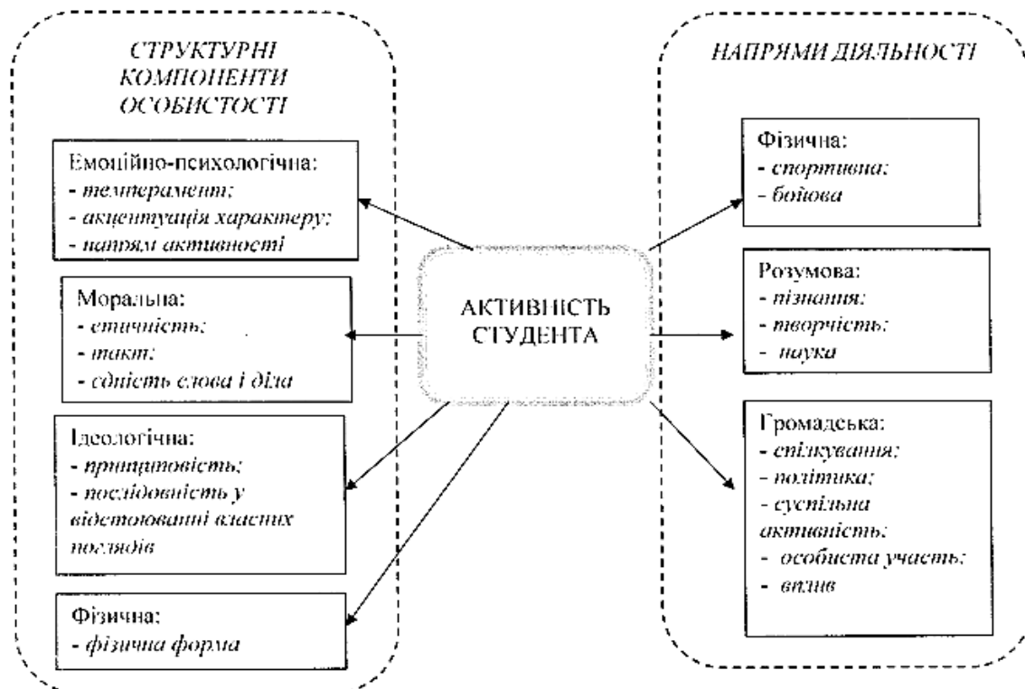
Рисунок. Класифікація активності особистості студента ВНЗ

Таким чином, ресурс активності особистості студента складається з сукупності характеристик особистості та зовнішніх умов ВНЗ, розвиток удосконалення яких є вагомим фактором самореалізації студентської молоді.