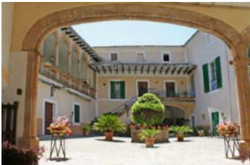
Рис. 1 – Средиземноморский внутренний дворик патио

Третья важная деталь архитектуры Средиземноморья – обязательное наличие в жилых зданиях балконов и просторных крытых террас. Характерным элементом жилища также является патио – внутренний дворик, заставленный горшками с тропическими растениями и цветами (рис.1).