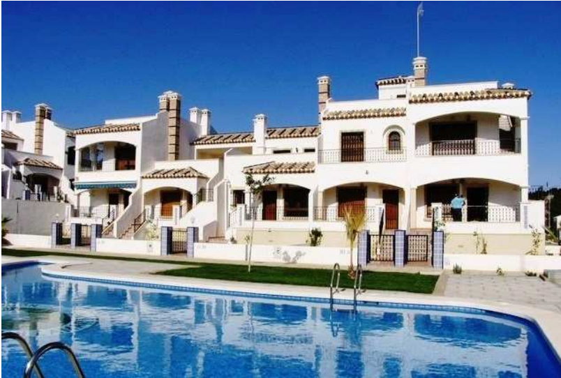
Рис. 6 – Испания, Валенсийское сообщество, комплекс Rocío

Многие виллы в Испании также представляют собой классику средиземноморской архитектуры. Правда для многих регионов характерны свои особые черты. Например, домам Андалусии присущи восточные мотивы: яркие цвета красных оттенков, башенки, балюстрады – так сказывается длительное присутствие арабов. А вот виллы Валенсийского сообщества имеют ярко выраженные черты средиземноморского стиля – ослепительно белые или бежевые стены, высокие лестницы, большие террасы (рис. 6).