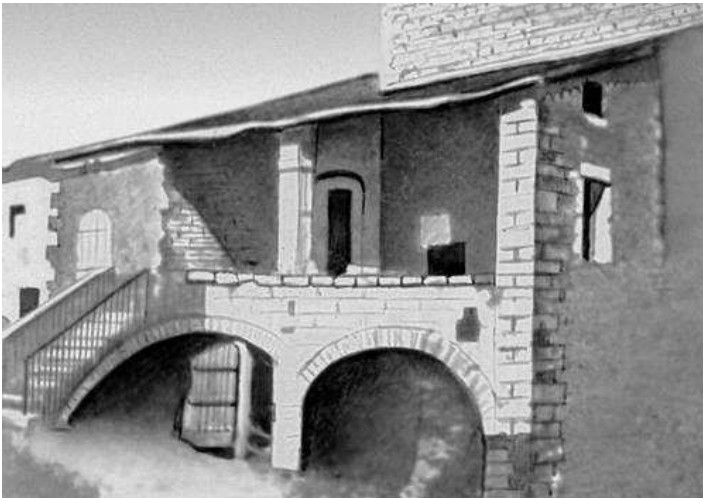
Рис. 3 – Дом средиземноморского типа

На второй этаж ведет внешняя лестница. Вход с продольной стороны. Перед входом лестница заканчивается небольшой площадкой или же ведет на вытянутую вдоль всей стены галерею. Разумеется, этот комплекс главных признаков, на основании которого производится классификация, на практике неизбежно дополняется, изменяется и варьирует в разных странах и областях Средиземноморья в зависимости от природных условий, хозяйственной деятельности населения и местных традиций (рис. 3).