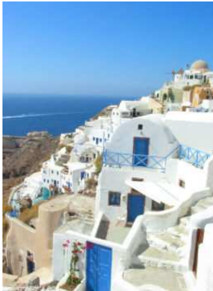
Рис. 2 – Бело-синий стиль Киклад

Когда говорят о средиземноморской архитектуре в Греции, то имеют в виду, прежде всего, «кикладский стиль». Именно на островах Кикладского архипелага зародилась традиция покраски стен домов белой штукатуркой, а оконных рам и дверей – синей или голубой краской. В целом лаконичные постройки выглядят очень ярко и празднично на фоне ослепительного греческого неба. С 1974 года все дома в этом регионе в обязательном порядке выкрашиваются в бело-синие цвета (рис. 2).