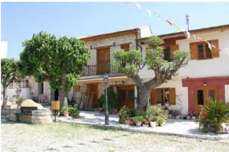
Рис. 5 – На Кипре сильна греческая традиция

Греческие традиции строительства жилья оказали влияние и на архитектуру Кипра (рис.5). Однако она, все же, отличается от греческой, и дома в кикладском стиле на острове скорее редкость.