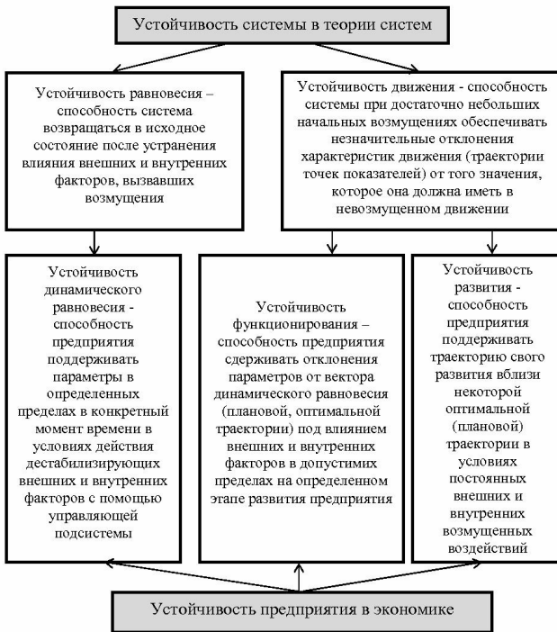
Рис.2 – Интерпретация понятия «устойчивость системы» в экономике относительно предприятия

торые могут быть выражены через значения (множество значений) функции системы. Учитывая это, совокупность точек в пространстве, в которых предприятие достигает состояния динамического равновесия, можно рассматривать как желаемую (запланированную) линию поведения системы, когда согласуются потребности и ресурсы предприятия, как траекторию ее эволюции. Поэтому устойчивость функционирования предприятия представляет собой устойчивость по достижению намеченных целей в конкретный период времени. Переход системы от одной траектории функционирования в другую представляет собой изменение динамического равновесия, установления на другом уровне, фактически отражает переход к новой ступени развития системы.