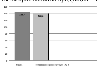
Рис. 1. Диаграмма снижения удельного расхода условного топлива на производство тепловой энергии

Кроме этих масштабных планов по повышению эффективности работы станции, внедряются и другие мероприятия, снижающие затраты на производство продукции – тепла и электроэнергии.