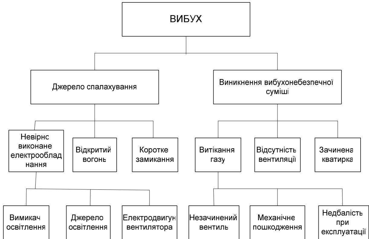
Рис. 3.2 — Приклад ієрархічного дерева "причин-небезпек"

Варіанти негативних подій наведені в таблиці 3.3