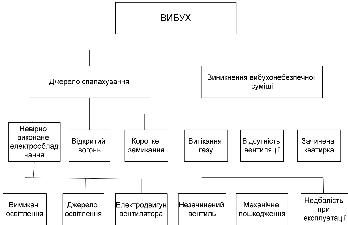
Рис. 3.2 — Приклад ієрархічного дерева "причин-небезпек"

Варіанти негативних подій наведені в таблиці 3.3