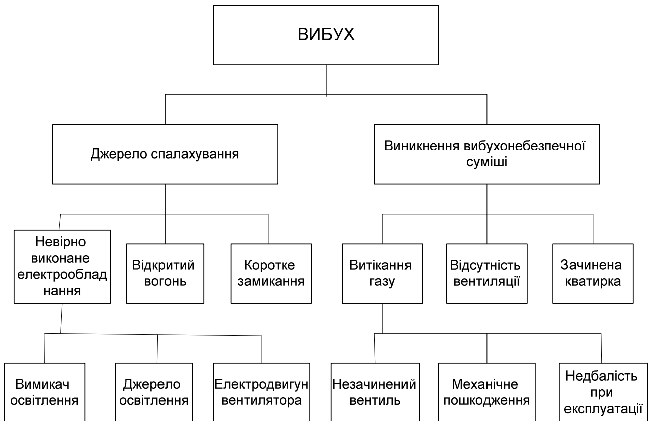
Рис. 3.2 – Приклад ієрархічного дерева "причин – небезпек"