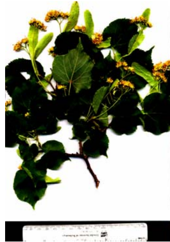
Рис. 10 – Липа серцелиста ( Tilia cordata )