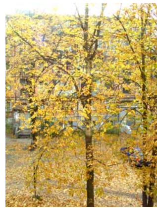
Рис. 8 – Гірськокаштан кінський ( Aesculus hippocastanum )