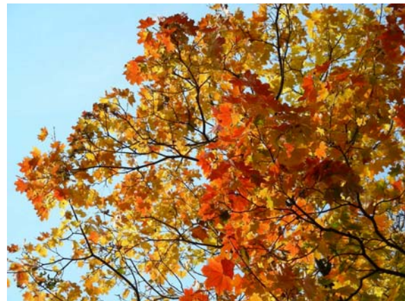
Рис. 6 – Клен гостролистий ( Acer platanoides )