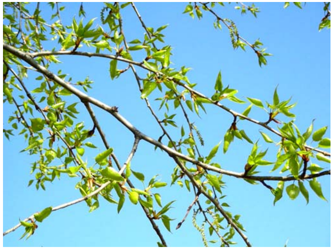
Рис. 2 – Тополя бальзамічна ( Populus balsamifera )