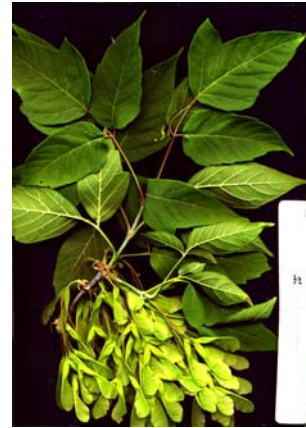
Рис. 7 – Клен американській ( Acer negundo )