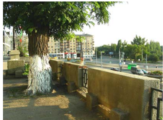
Рис. 9 – Робінія несправжньоакацієва ( Robinia pseudoacacia )