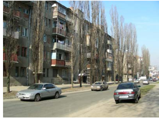
Рис. 4 – Тополя пірамідальна ( Populus x italica )