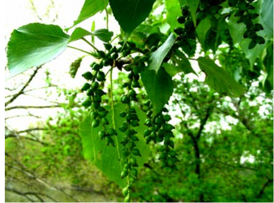
Рис. 1 – Тополя чорна ( Populus nigra )