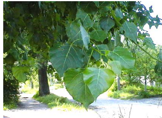
Рис. 3 – Тополя канадська ( Populus deltoides )