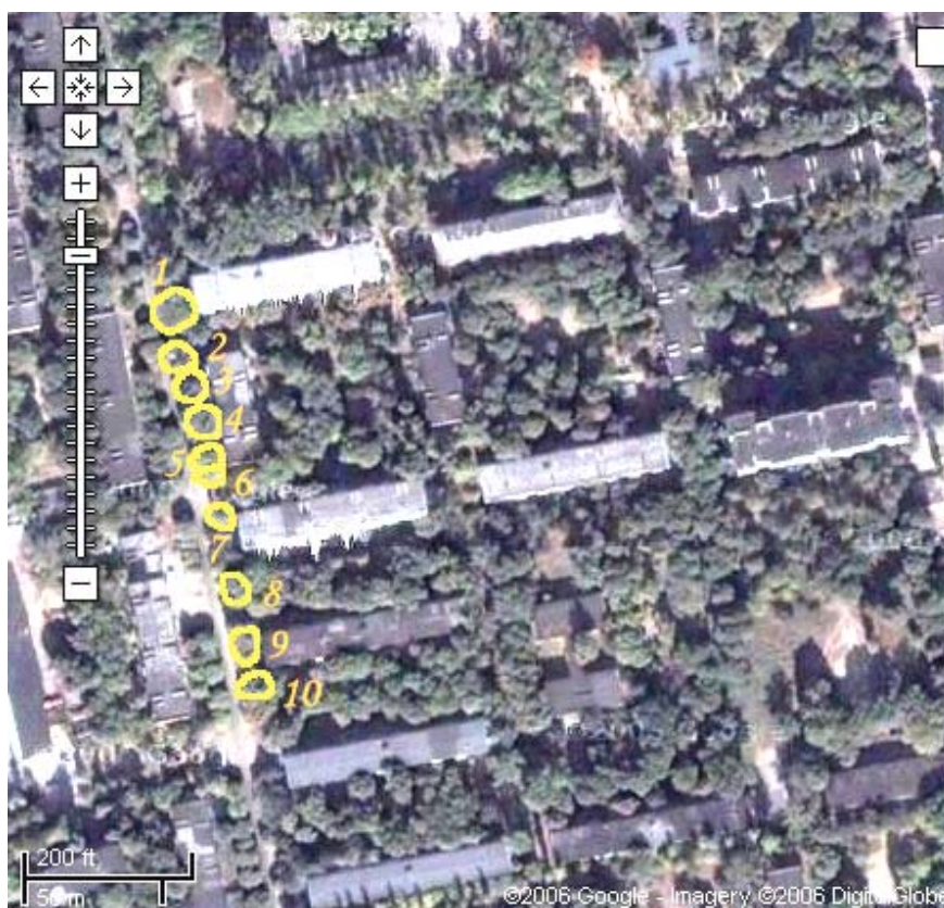
Рис. 13 – Схема ділянки із нанесеними та пронумерованими деревами

На схемі позначити індивідуальні дерева та пронумерувати їх (див. Рис. 13).