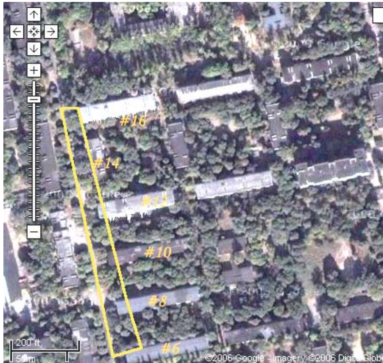
Рис. 12 – Приклад робочої карти пробної ділянки. Вуличні насадження