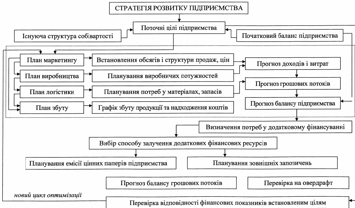
Рис.2 – Послідовність фінансового моделювання бізнес-плану підприємства