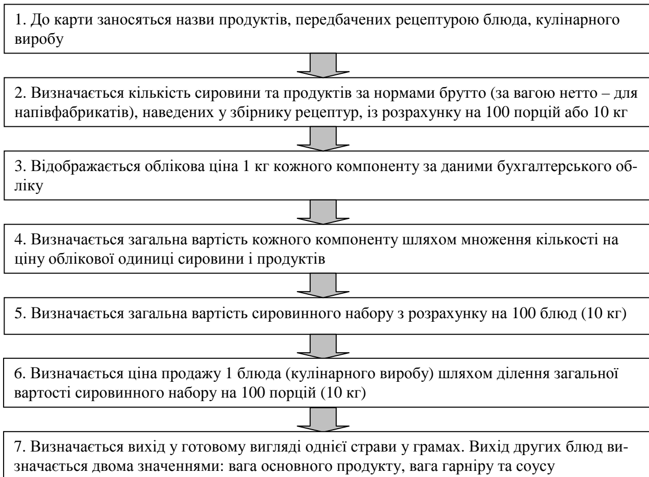
Рис. 4. Послідовність дій при складанні калькуляції вартості блюд

6. Дидактичне забезпечення: під час вивчення цієї теми студенти повинні вивчити послідовність дій під час складання калькуляції вартості блюд. Вона наведена у вигляді рис. 4.