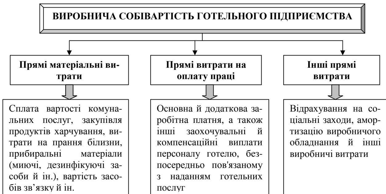
Рис. 3 – Склад виробничої собівартості готельного підприємства

8. Дидактичне забезпечення: під час вивчення теми 4 студенти повинні дослідити склад витрат виробничої собівартості готельних послуг. Ця інформація наведена на рис. 3.