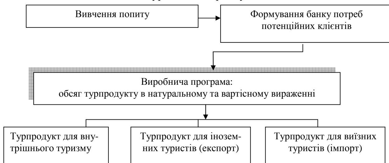
Рис. 2 – Алгоритм розробки виробничої програми туристичного підприємства