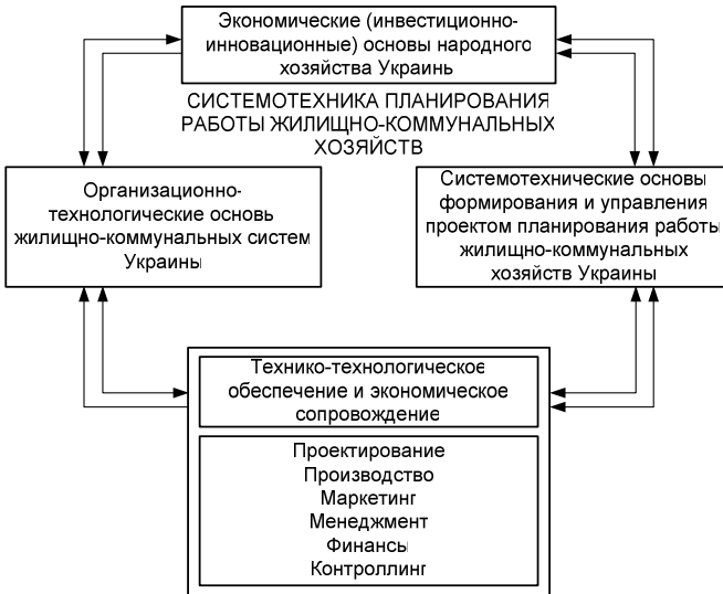
Рис.1 – Место системотехники планирования работы жилищно-коммунального хозяйства

Суть данного процесса заключается в том, что он предшествует функционированию инфраструктуры жилищно-коммунального хозяйства, эксплуатации, реновации жилищно-коммунальных систем (ЖКС) народного хозяйства Украины и их эксплуатации и через создаваемые в ходе планирования разработки проектов макро- и микроэкономические модели будущих фондообразующих структур ЖКС Украины и объектов полного жизненного цикла осуществляется реализация и управление программами и проектами инвестиционно-инновационных решений, которые в конечном счете определяют эффективность всего хозяйственного сектора экономики Украины [5].