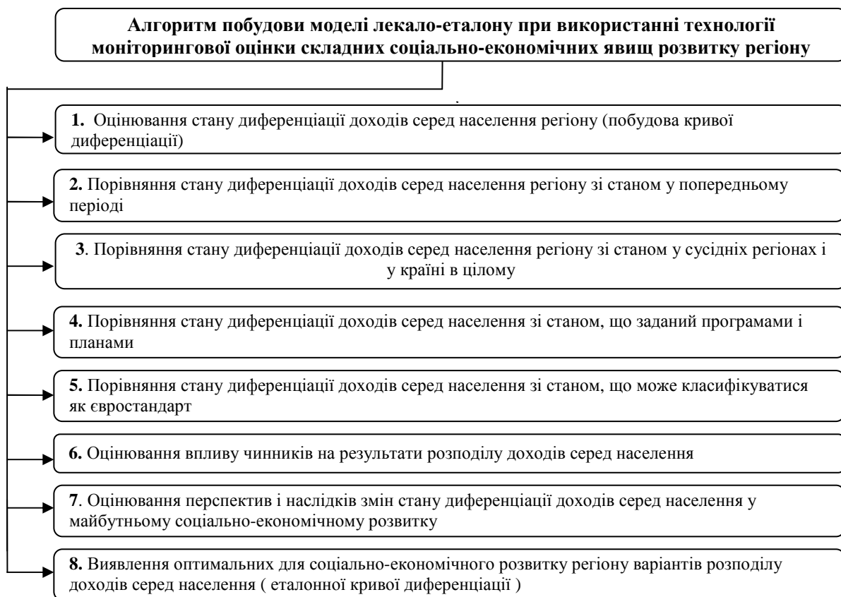
Рис. 3. Алгоритм побудови моделі лекало-еталону при використанні технології моніторингової оцінки складних соціально-економічних явищ розвитку регіону

У дисертаційній роботі розроблено алгоритм побудови лекало-еталону (рис. 3):