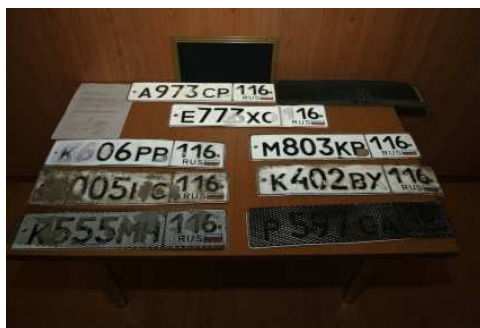
Рис.2 – Примеры намеренной порчи ГРЗ

На применение автоматических средств контроля нарушители ПДД реагируют по-разному. Большая часть, судя по статистике числа нарушений и аварийности, действительно меняет свое поведение на дороге. Наиболее злостные нарушители встают на путь борьбы с системами видеофиксации: закупают антирадары; устанавливают защитные экраны («сетки»), затрудняющие опознавание ГРЗ; умышленно сводят лакокрасочный материал с поверхности ГРЗ, чтобы ввести в заблуждение системы распознавания (рис.2).