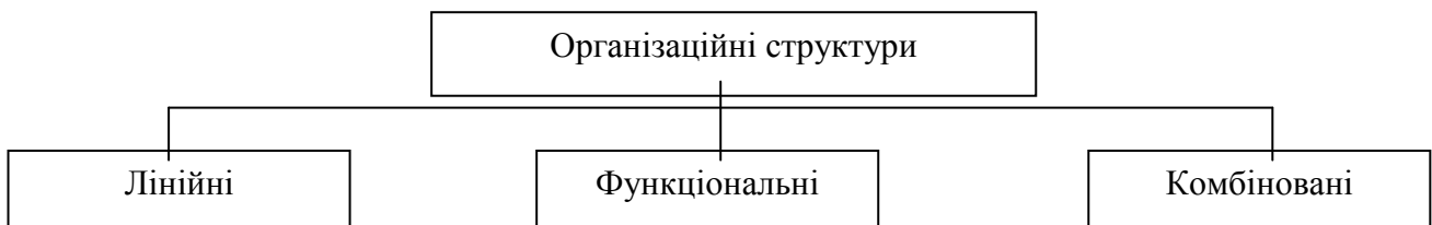
Рис. 5.1 – Класифікація організаційних структур

Згідно з чинним законодавством в Україні можуть створюватися й функціонувати два типи об'єднань підприємств та організацій (інтегральних утворень): добровільні та інституціональні. Нині на теренах України найбільш поширеними та ефективно діючими можна вважати асоціації (союзи, спілки), корпорації, консорціуми, концерни, холдинги, фінансові (промислово-фінансові) групи. Нижче розглянемо види структур управління, до яких найчастіше вдаються дані типи об'єднань підприємств. Існують два основні види структур управління: лінійна та функціональна (рис. 5.1).