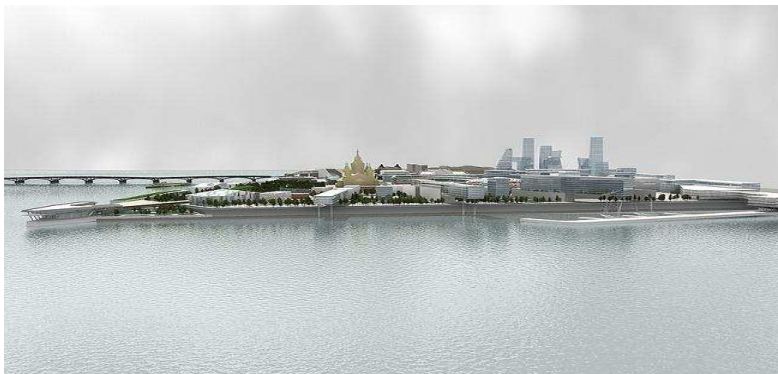
Рис.5 – Панорама з річки