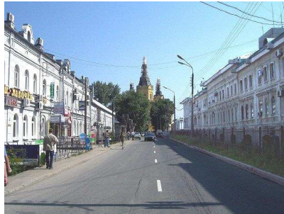
Рис. 4 – Концепція розвитку ділового центру. Взаємозв'язок історичних контекстів середовища і нових масштабів Нижнього Новгорода

Основною ідеєю і метою проекту є формування престижної торгівельно-ділової забудови при збереженні історичних цінностей місця і використанні його вигідного розташування.