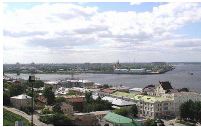
Рис.2 – Вигляд на стрільку