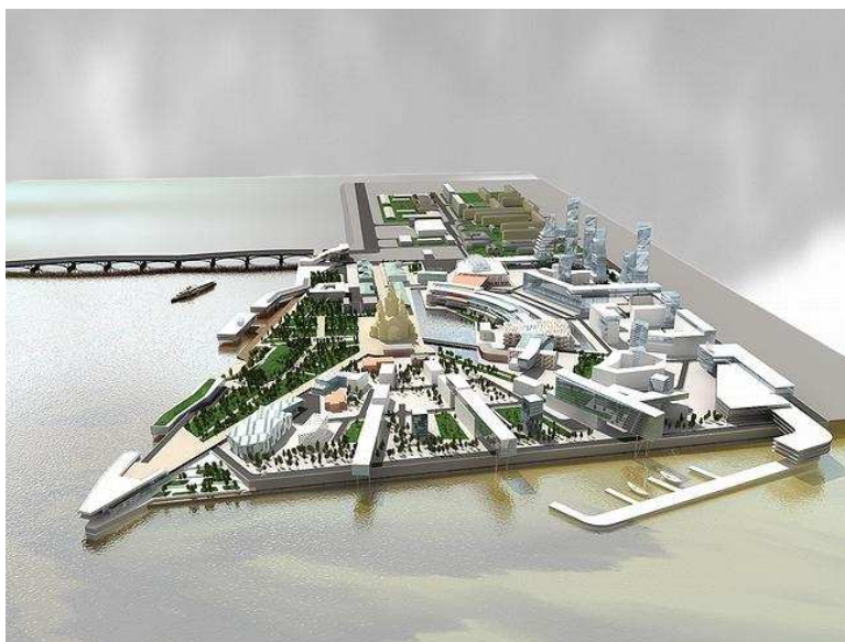
Рис.6 – Концепція розвитку ділового центру. Взаємозв'язок історичних контекстів середовища і нових масштабів Нижнього Новгороду. Композиція всього ділового центру підпорядкована собору.