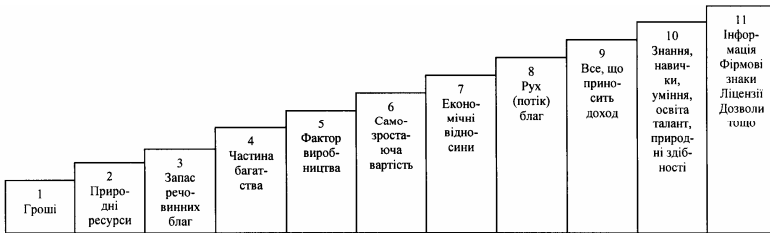
Рис.2 – Послідовний перелік цінностей, що за різних часів вважалися капіталом

Остання на сьогодні із загальних наукових теорій капіталу – це теорія всеосяжного капіталу І.Фішера, який назвав капіталом все те, що здатне протягом певного часу приносити дохід [17, 34]: „будь-яке благо, що приносить дохід своєму власнику, незалежно від сфери застосування є капіталом” [12]. Але тут варто зазначити, що І.Фішер не досліджував ані структуру, ані сутнісних характеристик капіталу, він просто максимально розширив коло цінностей, які можуть називатися капіталом, перелік яких доповнюється і до тепер (рис.2).