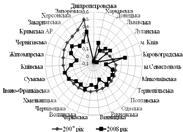
Рис.1 – Порівняльна оцінка фінансових станів ЖКГ регіонів України