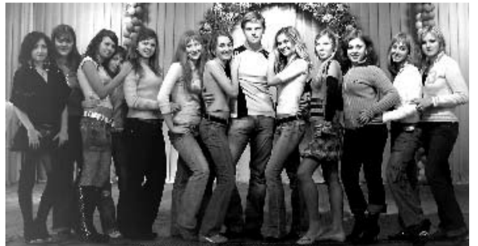
КОМАНДА ФАКУЛЬТЕТА ЭКОНОМИКИ И ПРЕДПРИНИМАТЕЛЬСТВА