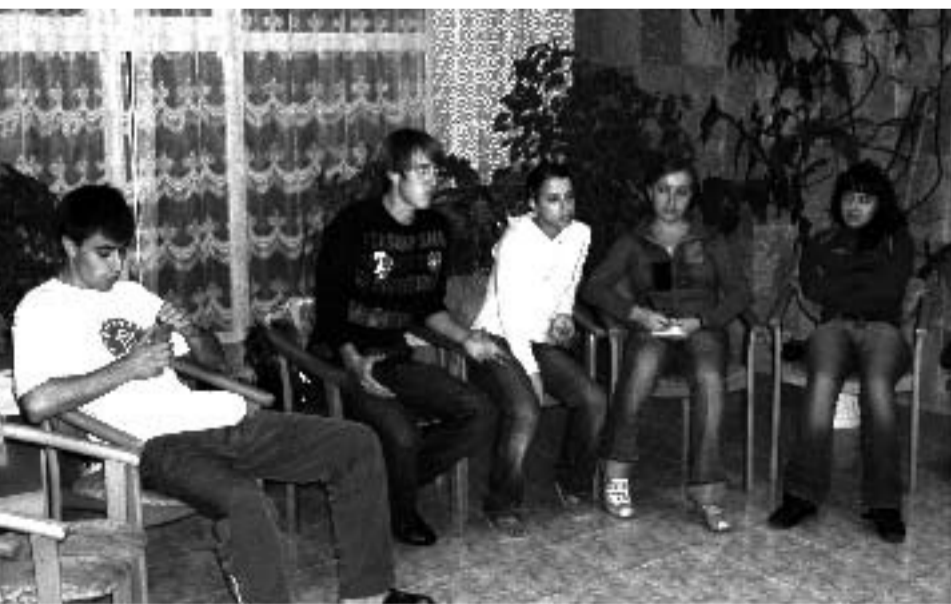
РАБОТА ПРОДОЛЖАЛАСЬ ДО ГЛУБОКОЙ ПОЧИ!!!!

- О проведении совместных спортивных мероприятий между ВУЗами (ХНАМГ и ХНУ им В.Н. Каразина) при содействии профкомов студентов. Было