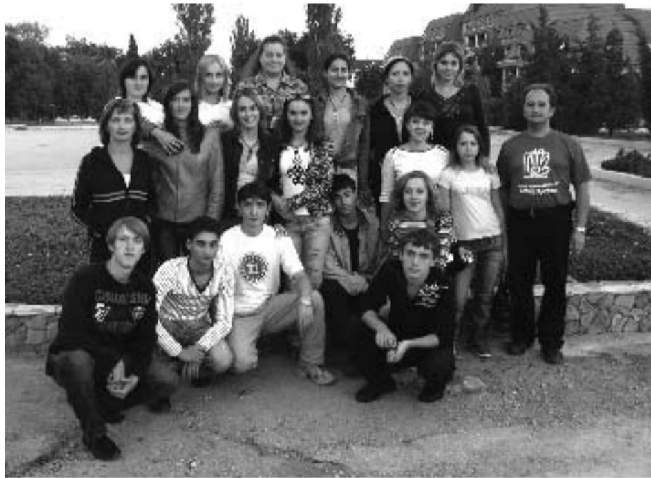
КОМАНДА ПРОФКОМА ТАКАЯ, КАКАЯ ОНА ЕСТЬ

предложено проведение спортивного проекта - «На коньки, к здоровью», представляющего из себя совместное катание на коньках студентов и членов профкомов обоих ВУЗов