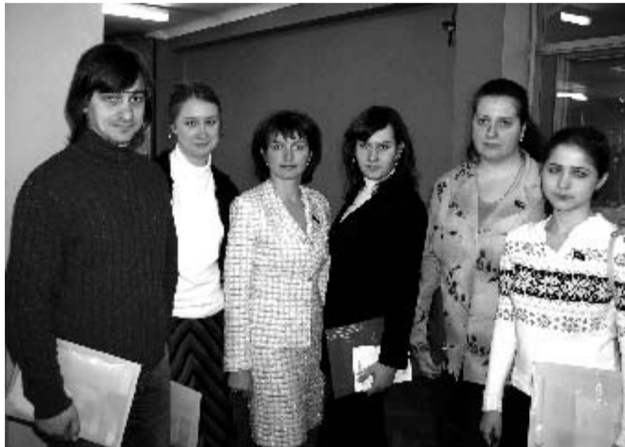
Мы представляем интересы студентов

Если Вы еще не являетесь членом нашего профсоюза, то рекомендую Вам взвесить все плюсы,