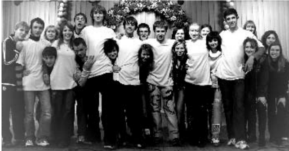
КОМАНДА ФАКУЛЬТЕТА ЭОГ

ВУЗа. Всегда на смену приходило новое поколение по-своему амбициозное, по-своему неповторимое и непредсказуемое.