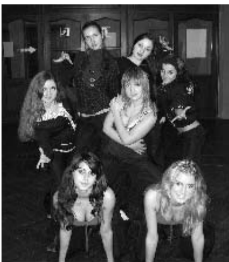
КОМАНДА ФАКУЛЬТЕТА МЕНЕДЖМЕНТ

ними, всегда найдутся и такие, которые не мыслят себя вне общественной работы, которые совмещают учёбу с танцами, песнями, шутками, смехом... во общем любят отдыхать, веселиться и заряжать своим задором окружающих! И кому, как не им защищать честь своих факультетов на всех культурно-массовых мероприятиях, проводимых в академии.